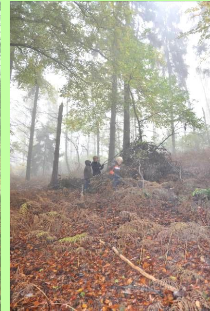
Deuxième essai : la construction.