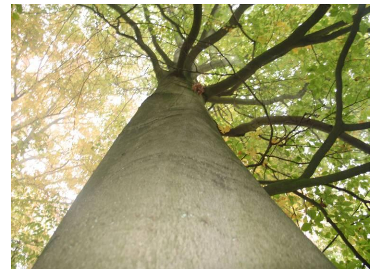
Côté gauche, l'automne. Côté droit, l'été.

La foulque est très facile à observer. Si vous allez dans le bois de Lauzelle, vous allez sûrement en voir sur un des étangs.