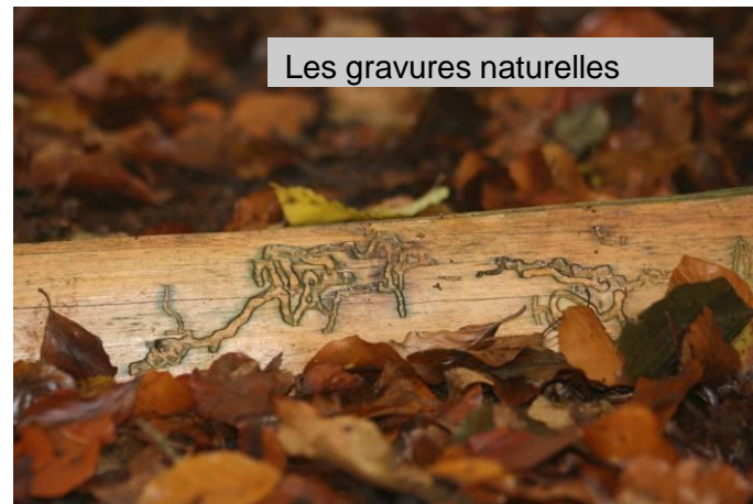
Les gravures naturelles