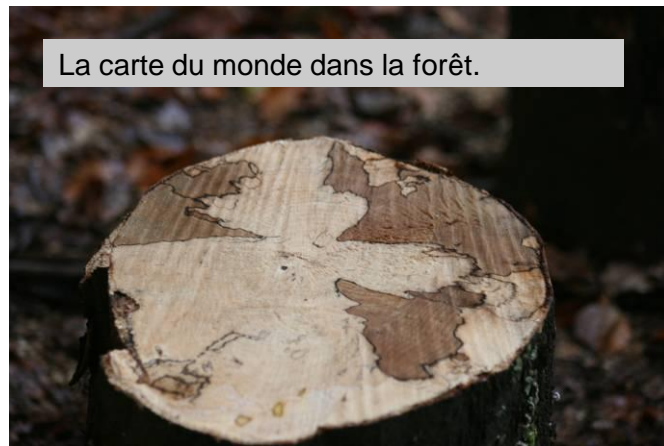
La carte du monde dans la forêt.